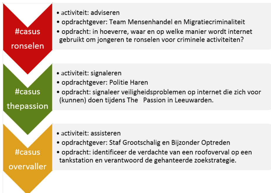
Figuur XX Drie casussen: activiteit, opdrachtgever en opdracht

Om te betrokkenheid van jongeren bij de TCF-pilot te vergroten, zijn ook drie hackathons georganiseerd. Het woord hackathons is een samenstelling van de woorden 'hacken' en 'marathon'. Ook tijdens de hackathons gaan de TCF'ers aan de slag met casussen. Ze werken in teams en presenteren de resultaten na afloop aan elkaar en aan de politie.